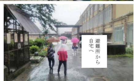
避難所から自宅へ