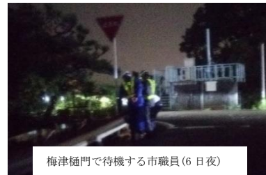
梅津樋門で待機する市職員(6日夜)