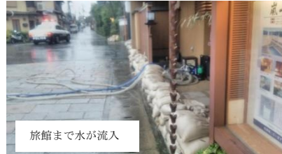
旅館まで水が流入

川も増水、バックウオーターも発生しました。5年前に起きた台風被害後の大規模工事で洪水への改善が見られました。ただし、嵐山地域で浸水被害が発生したこと、護岸のかさ上げ等の対策が必要です。