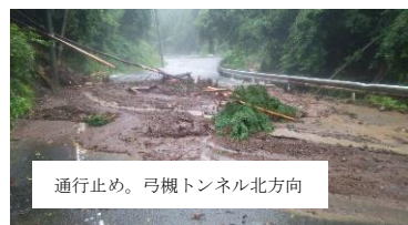
通行止め。弓橋トンネル北方向

大雨は京北各地でも被害が起きました。灰屋川の砂防ダムが壊れ、多量の土砂が下流に流出しました。