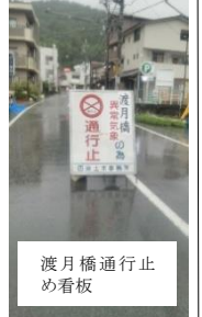
渡月橋通行止め看板

川も増水、バックウオーターも発生しました。5年前に起きた台風被害後の大規模工事で洪水への改善が見られました。ただし、嵐山地域で浸水被害が発生したこと、護岸のかさ上げ等の対策が必要です。