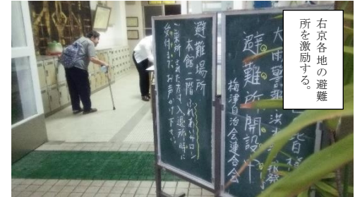
右京各地の避難所を激励する。