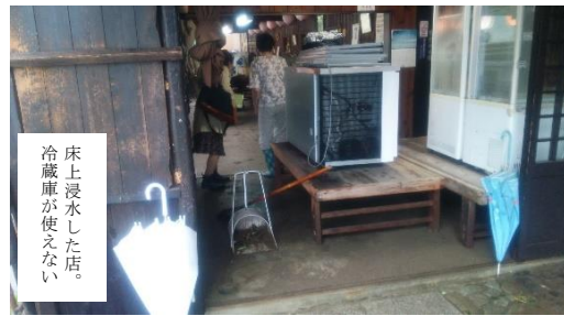
床上浸水した店。冷蔵庫が使えない